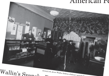
Wallin's Svenska Records - ett skivbolag i Chicagos 1920-tal

The Board wishes everyone a pleasant Summer!